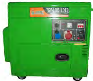
Diesel Geneset 7GF-LDE

Unit structure: silent type, four wheels Rated power: 5.5KW Maximum power: 6.05KW Rated frequency: 50Hz Rated voltage: 220V Excitation mode: AVR automatic adjustment Fuel tank capacity / working time: 25L / 12 hours Engine model: RZ188FAE Engine form: single cylinder four stroke air cooling Cylinder diameter × stroke: 88 × 75 Displacement: 456cc Fuel type: summer 0#, winter-10# Lubricant model: SAE15W/30 Lubricating oil capacity: 1.65L Start mode: electric start Battery capacity: 33Ah Unit size: 930 × 530 × 720 Packing size: 970 × 570 × 855 (carton) Net weight / gross weight: 157/168