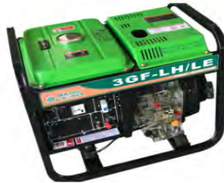
Diesel Geneset 3GF-LH/E

Unit structure: frame type, four small round Rated power: 3.0KW Maximum power: 3.3KW Rated frequency: 50Hz Rated voltage: 220V Excitation mode: AVR automatic adjustment Fuel tank capacity / working time: 12L / 8.5 hours Engine model: RZ178FA/E Engine form: single cylinder four stroke air cooling Cylinder diameter × stroke: 78 × 64 Displacement: 305cc Fuel type: summer 0#, winter-10# Lubricant model: SAE15W/30 Lubricating oil capacity: 1.1L Start mode: hand start / electric start Battery capacity: 20Ah Unit size: 645 × 490 × 550 Packing size: 665 × 510 × 570 (carton) Net weight / gross weight: 76/79